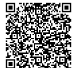
福山市ホームページ (携帯版) 休日診療医療機関