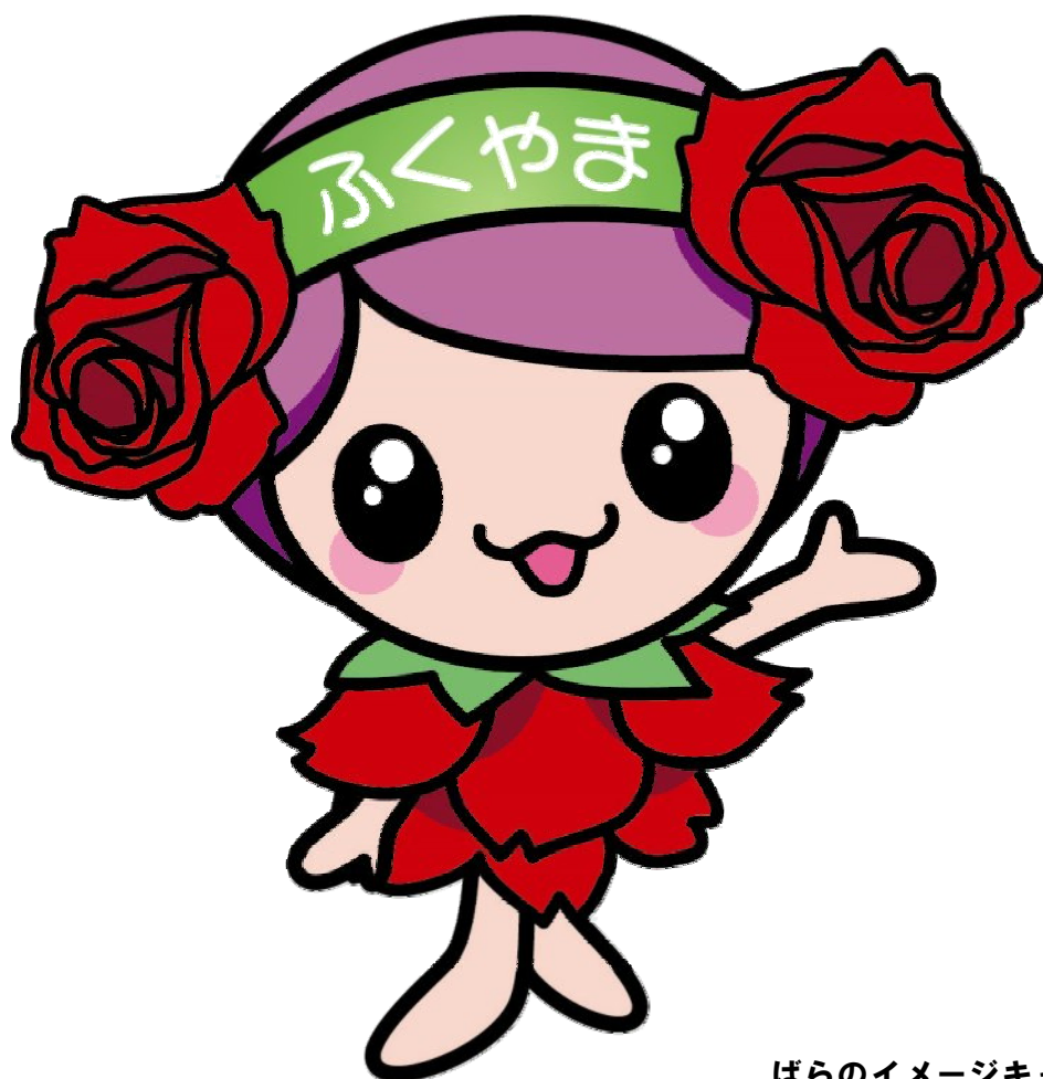
ばらのイメージキャラクター 「ローラ」