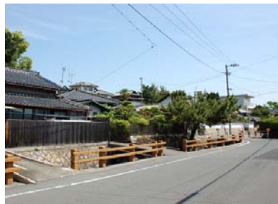
福山城跡風致地区

1982年(昭和57年)11月葎陽高校跡地を福山城跡風致地区に編入し、市街地における風致地区の拡大を果たし、現在では4地区合計785.3haについて風致の維持に努めています。