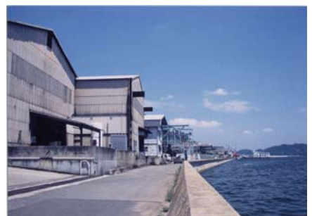
福山港臨港地区 白茅地区

また、1965年(昭和40年)12月に、取扱高の急増に対処し、臨港施設の整備を促進するため、尾道糸崎港のうち111.4haを臨港地区に指定しました。その後、2006年(平成18年)3月に、臨港地区を取り巻く環境の変化に適切に対応する臨海部の効率的な土地利用、港湾における諸活動の円滑化及び港湾機能の効率化を図るため、189.2haへと区域を拡大しました。