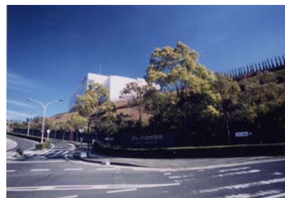
福山市大門特別工業地区

また、1984年(昭和59年)7月には新市町において、繊維産業の保護・育成を図る特別工業地区を定めています。