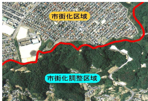
市街化区域・市街化調整区域

地区のうち、計画的市街地整備が明らかになった春日東地区、平成台地区、引野第一地区、旭丘工業団地地区、佐賀田団地地区について市街化区域に編入を行っています。2001年(平成13年)の総合計画の見直しにおいては、駅家加茂地区I期、御幸拠点地区、イーストコート明王台地区、テクノ工業団地地区等を市街化区域に編入し、新たに御幸地区、清水台地区、内港埋立地区、高西丁卯新涯地区、道上地区を特定保留フレームとして位置付けました。このうち、内港埋立地区、道上地区については、2005年(平成17年)に市街化区域への編入を行っています。