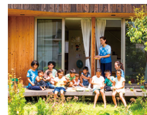
たんぼぼごはんの会

育児セラピストを中心とした子育てに関するハッピーや不安をおしゃべりで共有する「ママ日タミーティング」を開催。週2日、古民家を利用した交流の場をオープンし、親子で楽しめるように。