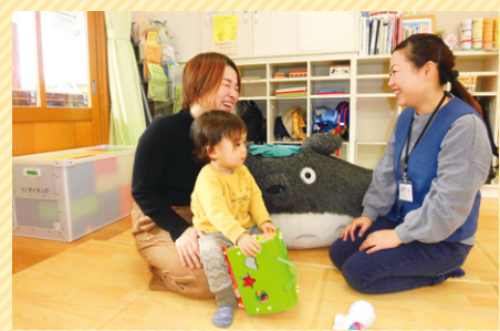
ネウボラ相談員が丁寧に対応。開設場所は、西町、伊勢丘、神辺、新市、松永など市内全域にわたる

「ネウボラ」とは、フィンランド語で「助言の場」を意味する。「福山ネウボラ」は妊娠・出産・子育てに関する総合的な支援制度。幅広い相談にワンストップで応じるネウボラ相談窓口「あのね」を市内12カ所に開設し、切れ目のない支援を行う。アットホームな雰囲気、利用したママたちからは「丁寧に話を聞いてもらい安心できた」「近所にあるので気軽に立ち寄れる」といった声も。