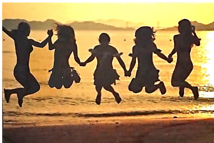
2017年度応募作品から

発行 松永生涯学習センター編集室 住所 福山市松永町三丁目1番29号 電話 084-934-5443 FAX 084-934-8251 メールアドレス matunaga-shougai-gakushuu@city.fu kuyama.hiroshima.jp