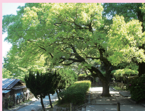
ふくやまじょうこうえん 〔福山城公園のクスノキ〕