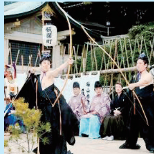
ゆみしんじ 〔お弓神事〕