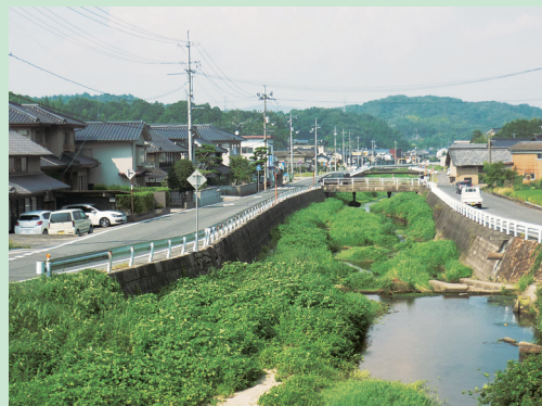
あるじがわ 〔有地川〕