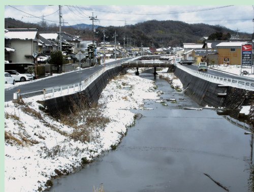
あるじがわ 〔有地川〕