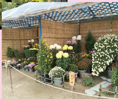
ふくやまじょうきつ かてん 〔福山城 菊花展〕