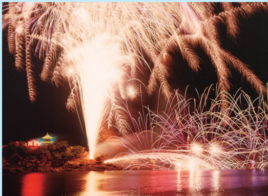
とも うらべんてんはなび たいかい 〔鞆の浦弁天花火大会〕