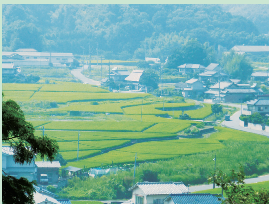
あしだちょう でんえんふうけい 〔芦田町の田園風景〕