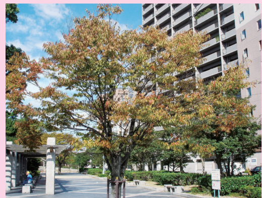
ふくやまじょうこうえん みずしろ 〔福山城公園 水の城〕