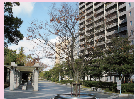
ふくやまじょうこうえん みずしろ 〔福山城公園 水の城〕