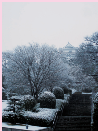
ふくやまじょうこうえん 〔福山城公園〕