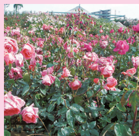
みどりまちこうえん 〔緑町公園〕