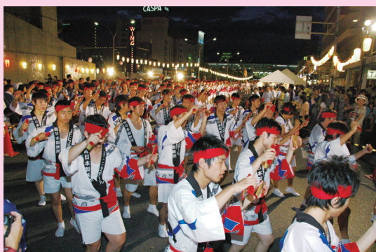
にあが おど 〔二上り踊り〕