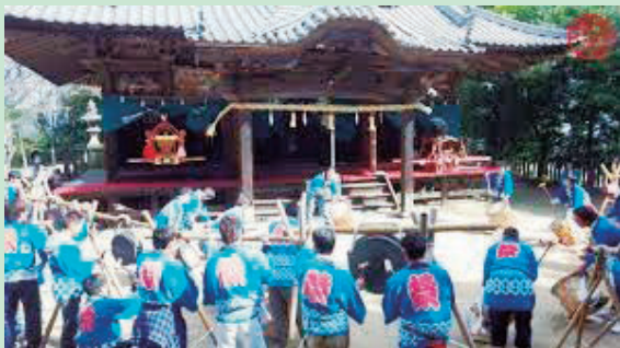
うしとらじんじゃ 〔良神社〕