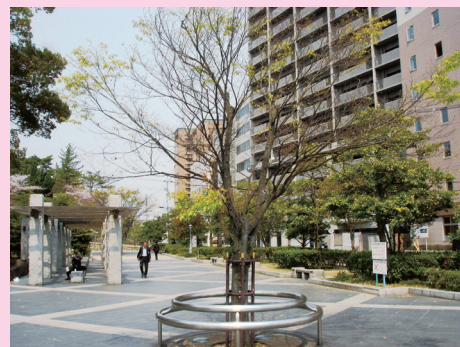
ふくやまじょうこうえん みず しろ 〔福山城公園 水の城〕