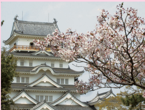
ふくやまじょう 〔福山城〕