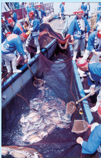
かんこうたいあみ 〔観光鯛網〕