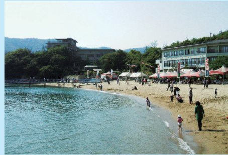
たの うらかいすいよくじょう 〔田ノ浦海水浴場〕