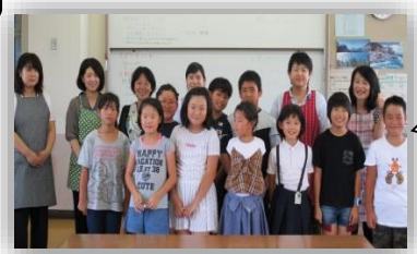
夏休み子ども料理教室