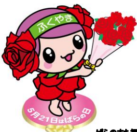
ばらのまち福山 イメージキャラクター ローラ

福山市では、戦後間もなく現在のばら公園に、市民有志が復興と平和を願い1000本のばらを植栽しました。この取組は多くの人々の共感を呼び、ばらづくりの輪は市内全域に広がっていきました。今では市内の至る所にばらが咲き誇っています。そして、市制施行100周年を迎えた2016年、「ばらの日」の5月21日に「100万本のばらのまち」を実現しました。今後は世界に誇れる「ばらのまち福山」をめざし、ばらのまちづくりに取り組んでいきます。