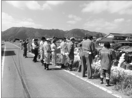
◀破堤した吉野川の応急対応を確認

建設水道委員会は、8月1日、7月豪雨による市内の被災箇所のうち3カ所〔吉野川（駅家町）、勝負迫上池、勝負迫下池（駅家町）、神村町の山腹〕の被害、復旧状況を視察しました。