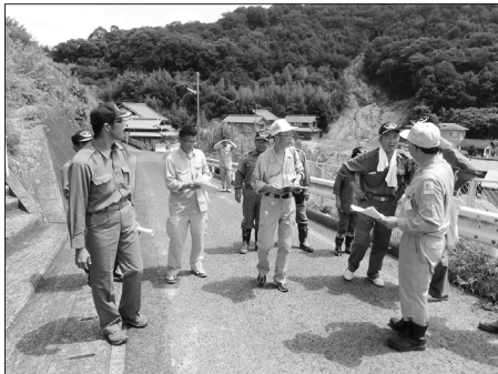
▶神村町の山腹の崩壊状況を確認