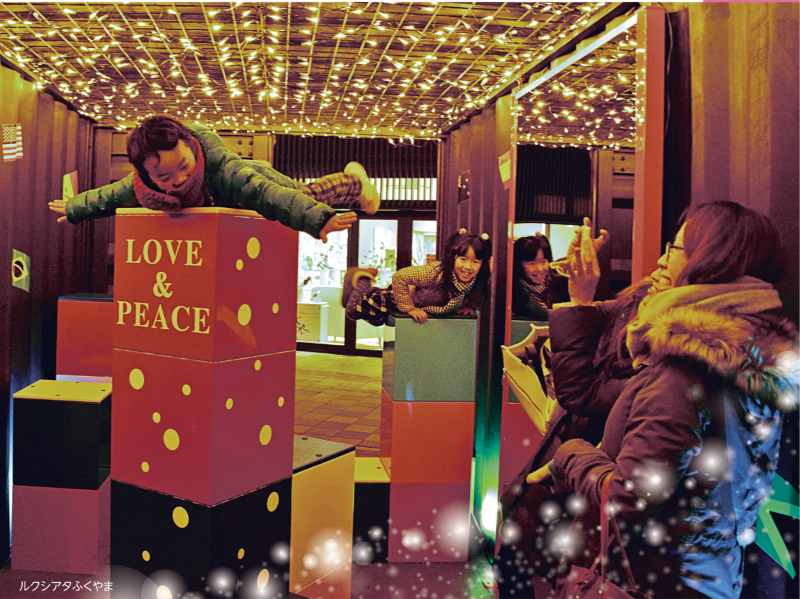
ルクシアタふくやま