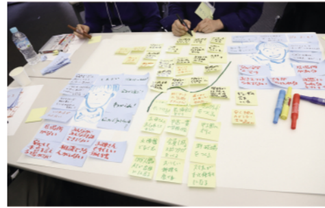
第3回の会議では、幸せにしたい人を思い浮かべてその人が笑顔になるために必要なものは何かを考え、今の状況や未来の姿などについて対話を深めながら、プロジェクトを考えました