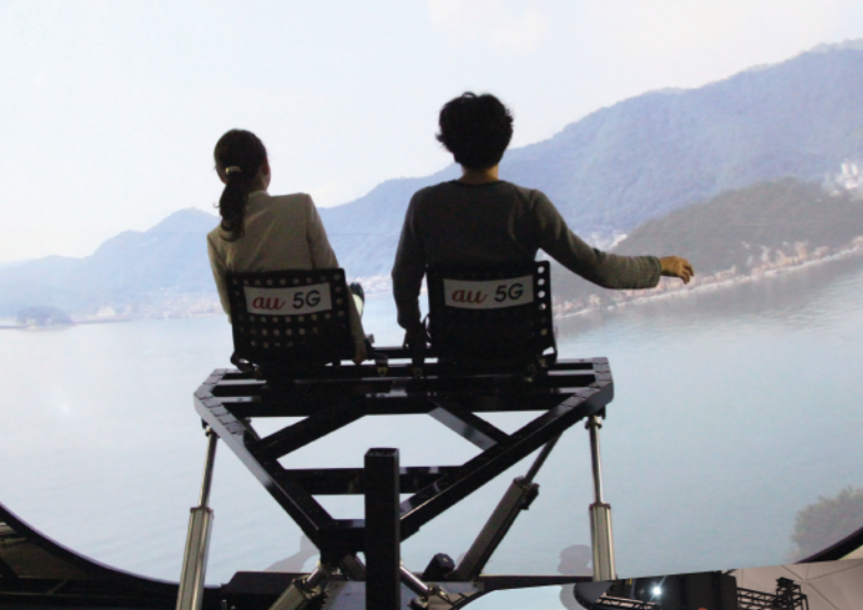
鞆の浦周辺の空撮映像がスクリーンに。来場者は福山市上空を飛んでいるような感覚を体験しました