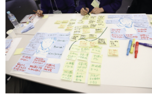
第3回の会議では、幸せにしたい人を思い浮かべてその人が笑顔になるために必要なものは何かを考え、今の状況や未来の姿などについて対話を深めながら、プロジェクトを考えました