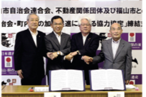
市自治会連合会、不動産関係団体及び福山市と自治会・町内会への加入促進に関する協定締結

自治会・町内会への加入促進に関する協定を締結 10月22日、地域のまちづくり活動の根幹を担う自治会・町内会を活性化するため、本市は市自治会連合会と(公社)広島県宅地建物取引業協会、(公社)全日本不動産協会広島県本部と「自治会・町内会への加入促進に関する協定」を締結しました。4月1日時点の自治会・町内会への加入世帯は12万6,858世帯で加入率は61.3%。5年前と比較すると加入率は4.4ポイント減少しています。 今後は不動産関係団体の協力で、集合住宅などの未加入者に対して自治会・町内会への加入案内や加入促進の働き掛けなどを行います。 本市は自治会連合会・不動産関係団体と連携し、自治会・町内会への加入促進の取り組みを進めていきます。