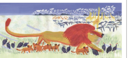
「ライオンのよいいちにち」2001年/佼成出版社 Hiroshi Abe

動物園の飼育係という経歴をもつ絵本作家あべ弘士の足跡を紹介。44タイトルの絵本や児童書の原画約240点を中心に展示。一般1,000円、高校生まで無料