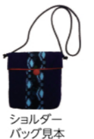
ショルダーバッグ見本

申込 3/15(金)(必着)までに、往復はがき(1枚で1人)で、住所・名前・電話番号・パッチワーク希望を、同館へ