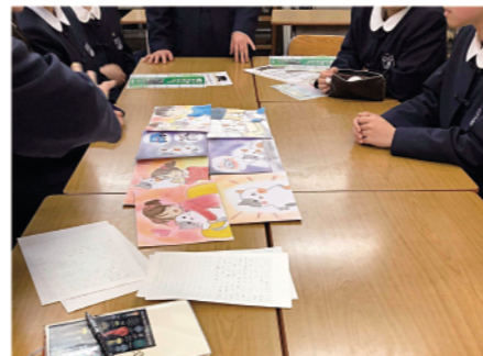
中学生と紙芝居の内容について検討する

猫の愛護活動に取り組む「ねこみ福山」は、子どもたちに生き物を飼う責任や命の大切さを伝えるため、福山暁の星女子中学校の生徒らと協働し、紙芝居を作成しました。ストーリーは、