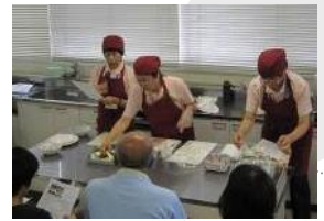
【ヘルスプランニング福山】 健康寿命をのぼそう栄養講座