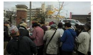
【名所・旧跡巡りの会】 福山の歴史の現地学習会

【問合せ先】 福山市役所まちづくり推進部 人権・生涯学習課 TEL(084)928-1243 FAX(084)928-1229