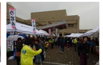
屋外の「おいしいもん広場」 もにぎわいました。