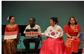
インタビュータイム「日本に 来てビックリ! したこと」