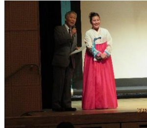
2/2プレイベント 「韓国映画上映会」

2月3日(日)に第10回フレンドリーピックまつながカープチェーを行いました。約80団体の協力、約85人のボランティアさん、約7000人の参加がありました。「10周年! ありがとう」感謝の思いを込めて、今後も、多文化共生のまちづくりをめざし、このイベントをきっかけに、日常につなげていけたらと思います。