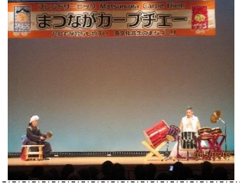
オープニングは、和太鼓と 韓国伝統打楽器の響演でした。