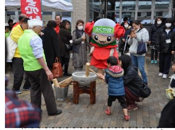
恒例のおもちつき体験