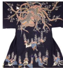
「筒描夜着 桐に鳳凰」

内生活用品や祝いの布として日本各地で親しまれてきた藍染め木綿による着物・ふとん地・風呂敷などを通して、筒描を中心に型染めや 紺など、藍のしごとで生み出された技法や伝統色などを紹介