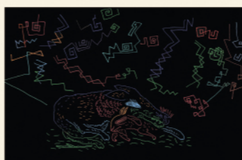
「あらしのよるに」文:木村裕一 1994年/講談社 ©Hiroshi Abe

あべ弘士(1948年)は動物園の飼育係という経歴をもつ、日本を代表する絵本作家の1人です。勤務していた旭川市旭山動物園は現在、動物たちのありのままの生態を見せる行動展示によって、多くの人々に驚きと感動を与えています。その展示には、あべが同僚たちと長年にわたり懸命に練り続けたアイデアが生かされています。あべは動物園在職中に発表した「雪の上のどうぶつえん」などのあしあとのまき(1989年)によって絵本の世界にデビューし、「あらしのよるに」(1994年/木村裕一)の挿絵で高い評価を受けました。動物たちを主人公にユーモアたっぷりに創り上げる独特の世界は、限りある命の尊さとこの世に生を受けた幸せを実感させてくれるものとして、多くの人々の心を捉え続けています。本展では44タイトルの絵本や児童書の原画約240点を中心に展示し、その魅力を紹介します。