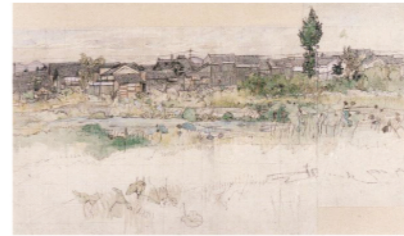
大村廣陽「風景・蓮池」1911年頃