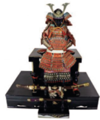
「鎧兜飾り」昭和中期 同館蔵

時5/19(日)まで 内幕末から現代までの武者人形・兜飾り・座敷職などを展示 ¥無料