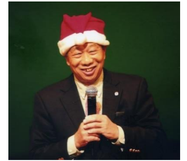
<昨年12月カラオケフェスティバルより>