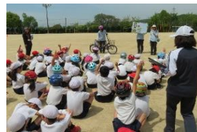
真剣に話を聴く児童