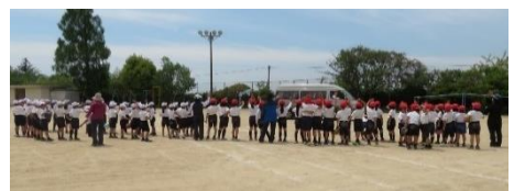
東村小児童を見送る今津小児童

★次回、第8回 開校準備委員会 は、7月4日（木）に開催します。（場所：西部市民センター）