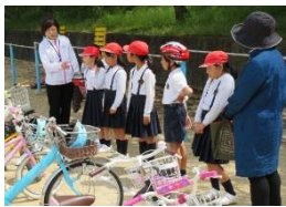
今津小児童を待つ東村小児童

子どもたちが新しい学校生活を円滑に迎えられるよう、交流事業を実施しています。今回は、東村小と今津小の3年生73人が、交通安全教室で、自転車の正しい乗り方（ヘルメットのかぶり方、ブレーキのかかけ方、走行前の安全確認など）と実技指導を受けました。最後に「飛び出さない、スピードを出さない、ヘルメットをかぶる」を皆で確認しました。