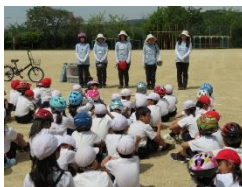
あいさつと目的説明