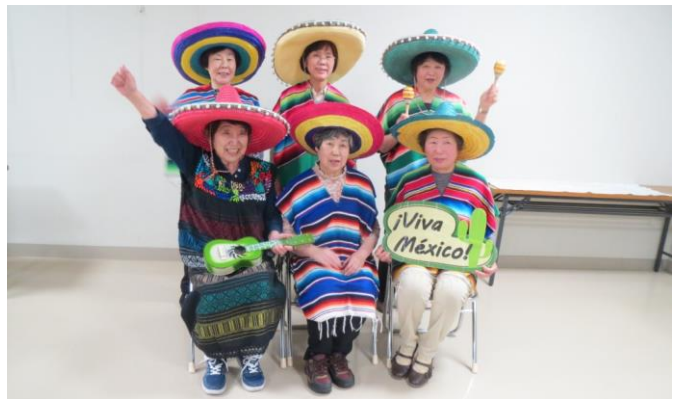
(ポンチョやソンブレロをつけて記念撮影をする受講者のみなさん)

松永公民館では、5月9日にメキシコ料理教室が開催されました。学区の食生活改善推進員さんが講師を務め、アボガドや豆を使ってタコスやディップを作りました。初めてメキシコ風料理を作る方も多く「めずらしいものをよばれました」「おいしかったよ」「盛り付けを工夫しました」などの感想を話され、料理を通してメキシコ文化を知るきっかけとなりました。