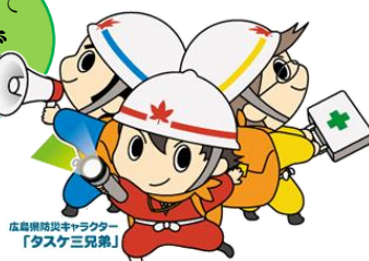
広島県防災キャラクター「タスケ三兄弟」

*今年度、南部生涯学習センターでは、防災に関する講座を開催します(詳しくは1ページ)