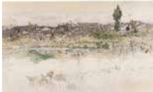
大村廣陽《風景・蓮池》1911年頃

色彩豊かな花鳥動物画を描いたことで知られる福山出身の日本画家・大村廣陽(1891-1983)は、風景画も多く残しました。本展では、廣陽の風景画を切り口に、詩情溢れる本画や瑞々しいスケッチの数々を展覧します。