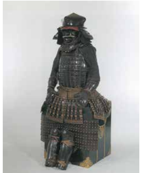
重要文化財《伊予札黒糸威胴丸具足(紺染具足)》久能山東照宮博物館蔵

静岡県中部の久能山山頂に鎮座する久能山東照宮は、徳川家康の遺命により元和2年(1616)に建立された国内最古の東照宮です。本展では、同社に伝来した家康遺愛の刀剣や甲冑を筆頭に、晩年を過ごした駿府で家康が使用した手沢品、徳川歴代将軍による奉納刀や自筆の書画といった宝物の数々を、ふくやま美術館、ふくやま書道美術館、福山城博物館の3会場に分けてかつてない規模で展覧し、武家文化の精髓をご堪能いただけます。