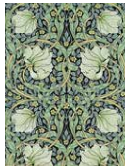
《ピンバーネル(るりはこべ)》1876年(印刷)

ウィリアム・モリス(1834-1896)のデザインを中心とした壁紙の展覧会です。英国有数の壁紙会社、サンダーソンが所蔵する日本初公開の約130点の壁紙やモリスの版木などを通して、19世紀に興隆期を迎えた英国壁紙デザインの変遷をたどります。また、会場内にモリスデザインの壁紙を使った撮影スポットを設け、モリスが目指した「美しい暮らし」を体感していただけます。