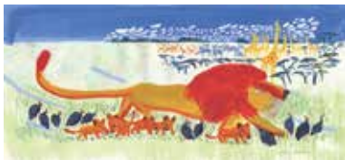
『ライオンのよいいちにち』(2001年/成成出版社) ©Hiroshi Abe

あべ弘士(1948-)は、動物園の飼育係という経歴をもつ絵本作家です。彼が勤務していたのは、日本を代表する動物園の一つ、旭川市旭山動物園。在職中の1989年、『雪の上のどうぶつえん -なぞの あしあとの まき-』で絵本の世界に登場し、1994年に手掛けた『あらしのよるに』(文:木村裕一)の挿絵は高い評価を受けました。そして、動物たちを主人公にした独特の世界を築き上げ30年、現在、日本を代表する絵本作家の一人となっています。本展は、作家自身の提案にも基づく、絵本、児童書の44タイトルの原画約240点などからその足跡を紹介いたします。