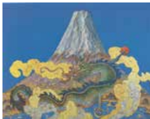
絹谷幸二《蒼天富嶽龍宝園》2008年 ©Krutani Koji

絹谷幸二(1943-)は、日本芸術院会員であり、現代アフレスコ画の第一人者です。奈良市に生まれ、これまで独立展を主な発表の場としながら国内外で数々の個展を開催してきました。本展では、日本人にとって親しみ深い富士山をモチーフにした作品を中心に、1970年代のイタリア留学時の作品から近年に描かれた風景や静物画まで、あわせて約70点により、鮮やかな色彩で彩られた絹谷の独創的な世界とその魅力を紹介いたします。