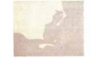
高松次郎《パイプをくわえた男》1970年

写実表現による陰影法、劇的な演出効果を生み出すバロックの光と影。また、20世紀の光と影の効果を利用した絵画とも彫刻ともとれる作品。影そのものがモチーフとなる作品。本展では、そのような影の存在がキーとなる作品を集め、影の担う役割を紹介します。