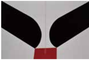
高橋秀《恍惚の瞬間》1986年

高橋秀(1930-)は、福山市新市町出身の芸術家です。初期の抒情的な風景画は、1961年に安井賞を受賞するなど高く評価されますが、1963年にイタリアへ渡り、鮮やかな色彩の抽象作品へと伸展し、1990年代後期には、「新琳派」と称するスタイルを確立。今も変貌を続ける60年余の軌跡を展覧します。