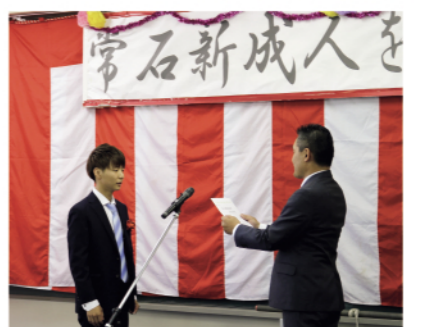
成人認定書を受け取る新成人

毎週水曜日に山手公民館で開催している喫茶店風サロン「ふれあいサロン山手」に入れたてのコーヒーとお菓子を囲み、住民のおしゃべりの輪が広がります。 2018年度は年間約1,500人が利用。隣接する山手小学校の児童が学習活動の発表や行事のPRのために3年前から毎回サロンに来てくれるようになり、住民の楽しみが増えました。児童がサロンに来る小学校の大休憩の時間には保護者