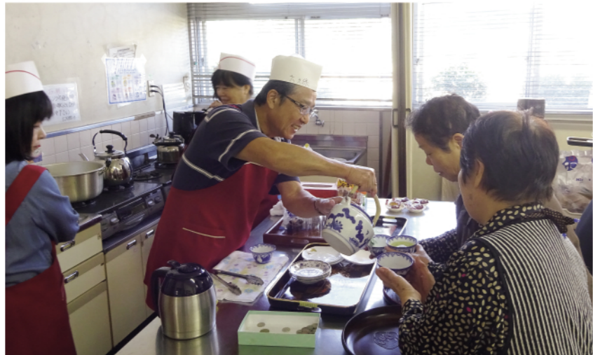
カップも湯煎。細やかなサービスです

も集います。 「今日はうちの孫がサロンに来るんだよ」「演奏良かったなあ。発表会が楽しんじゃなあ」と児童との交流の積み重ねにより、地域の子どもたちの成長を温かく見守る住民が増えています。 運営役のボランティアが忙しい時には、集っている住民に「ちょっと手伝って」と声を掛けると「おまじい。ボランティアの楽しさに目覚め、運営側として関わ