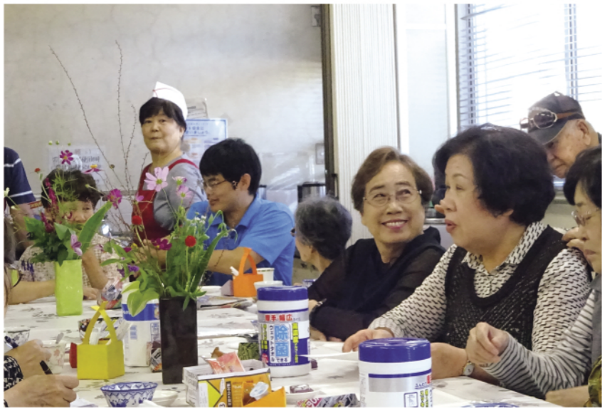
喫茶店風サロン「ふれあいサロン山手」