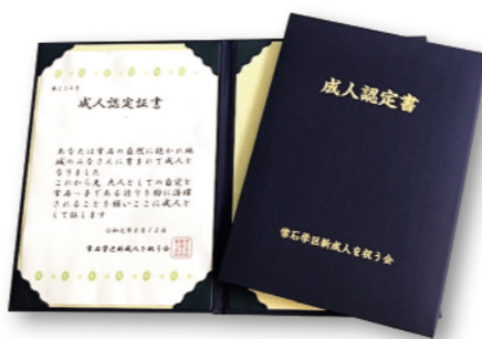
手作りの成人認定書

新成人と地域の人々をつなぐこの取り組みは、若い世代が地域づくりの担い手として貢献する新たな活躍の場につながっています。 気軽に集える 居場所づくりが 広がっています 【山手学区】