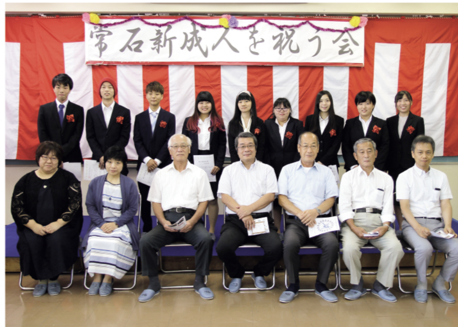
久しぶりの再会に笑顔で写る新成人の「常石っ子」と地域の皆さん