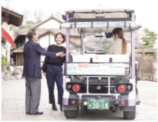
鞆の浦観光に訪れる人にも利用されています