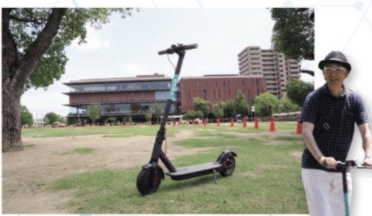
2019年7月に行われた市民参加型の電動キックボード試乗体験会には、10代から80代まで約100人が参加しました

次世代の短距離移動手段として注目を集める電動キックボードなど、電動マイクロモビリティの安全性や利便性を検証。GPSやキャッシュレス決済機能の利用も今後検証予定で、結果を地域の回遊性向上や活性化につなげていきます。