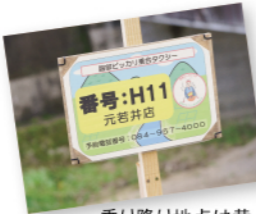
乗り降り地点は黄色の看板が目印

利用が少なかった路線バスの代替手段として、高齢者が多い地域の実態に合わせた乗合タクシーの運行を検証。スマートフォンアプリなどで希望日時や行き先などを予約すると、AIにより効率的に乗合タクシーが配車されるシステムの有効性や利便性が実証されました。