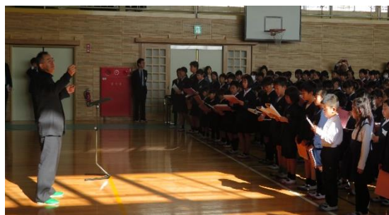
気持ちよく歌うためのポイントを指導いただきました。