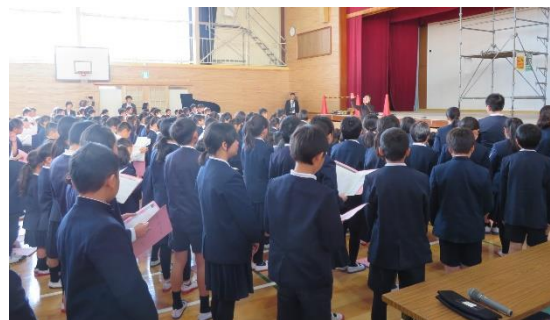
最後を通して歌唱気持ちを込めて歌いあげました。