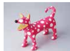
草間彌生《私の犬のリンリン》2009年（寄贈：KDDI株式会社）

本来的な意味を超え、現代日本文化を象徴する美的判断として多用される「かわいい」。本展では、「かわいい」作品たちを通して、この不可解な言葉の深淵を探ります。