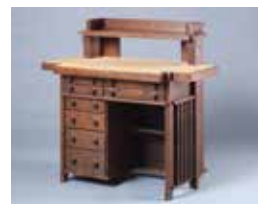
フランク・ロイド・ライト《帝国ホテルの机》1920年頃

画家や建築家として活躍しつつ、デザインの分野でも優れた実績を残しているジヤコモ・パツラや武田五一の作品を中心に、ふくやま美術館のデザインコレクションを紹介します。