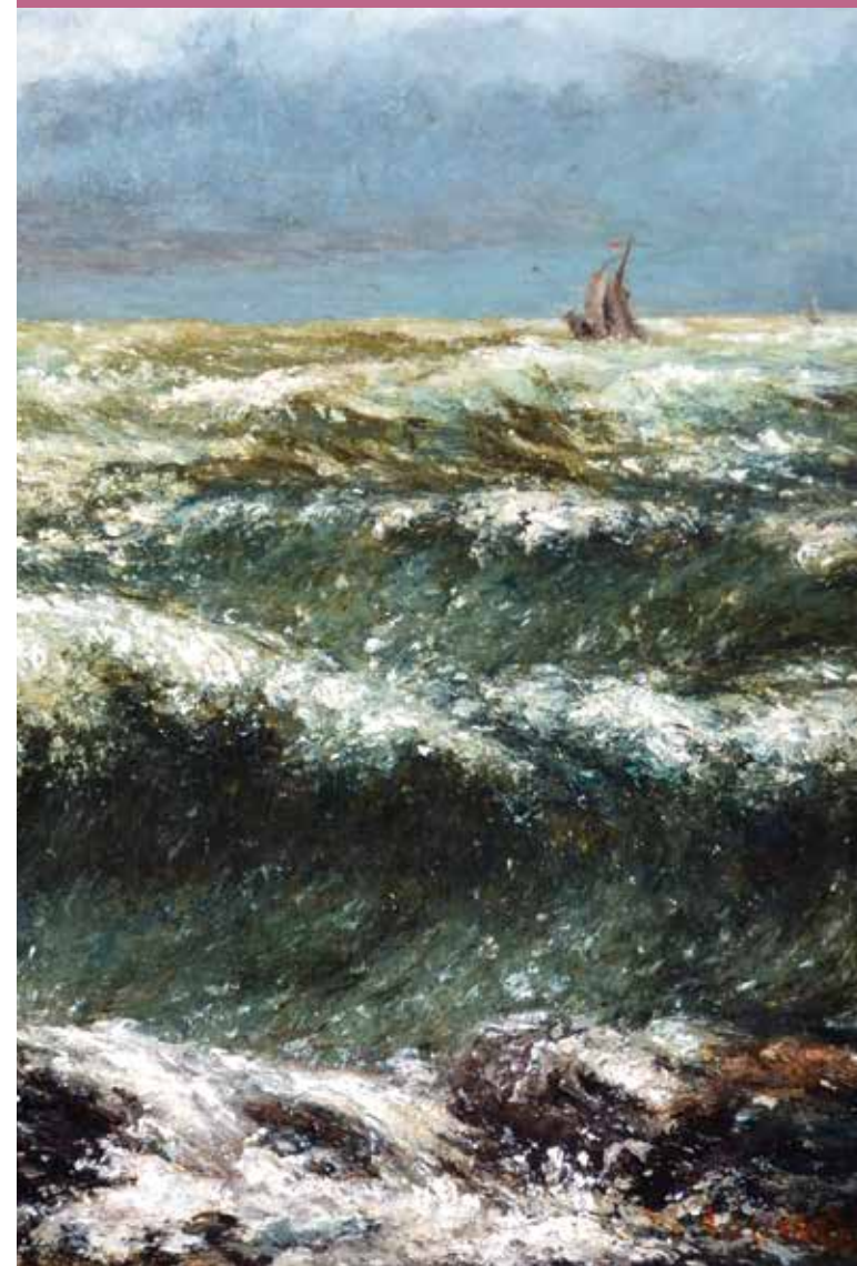
ギュスターヴ・クールベ《波》(部分) 1869年

2020 2020 2020 ふくやま美術館 FUKUYAMA MUSEUM OF ART 展覧会カレンダー