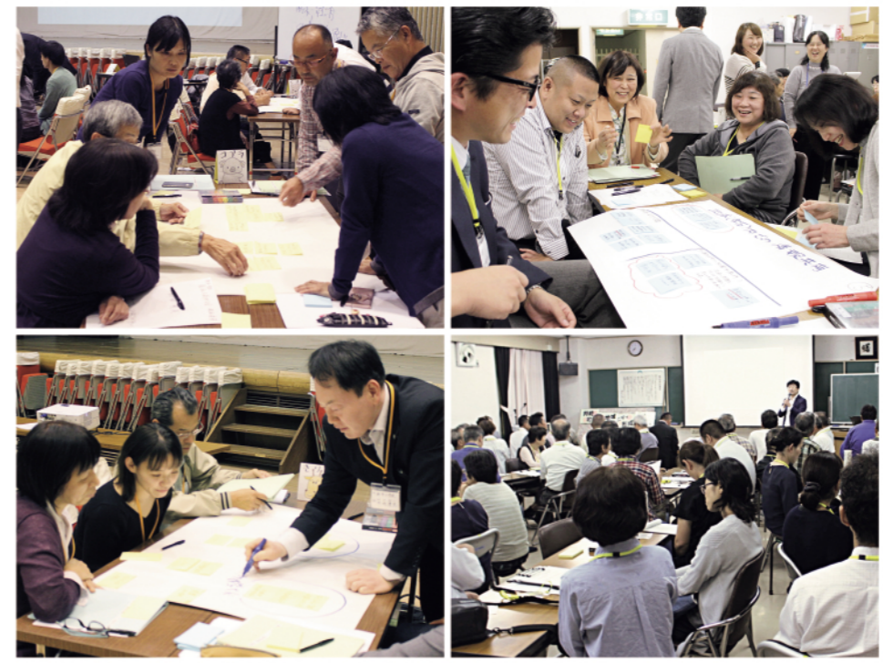
持続可能な地域コミュニティ形成モデル事業(地域づくり座談会)

人口減少・少子高齢化が進む中、地域活動の担い手不足や役員の高齢化など、地域にはさまざまな課題が生じています。 こうした背景を踏まえ、2019年度に「福山市持続可能な地域コミュニティ形成モデル事業」を実施しました。全学区に実施希望を聞き、曙・新市学区を選定。モデル事業では、幅広い世代の住民が地域づくりについて本音で話し合う「地域づくり座談会」を開催し、地域のビジョンを出し合い、地域課題への具体的な解決策を考えています。 実施学区では、住民が意見を交わす中で世代を越えて交流が深まり、地域づくりに対する関心が高まっています。今後も話し合いを重ね、地域事情に応じた取り組みを実践していく予定です。 地域を見つめ直し、活動を振り返ることから地域づくりは始まります。あなたの地域でも、みんなで話し合う場をつくってみませんか。