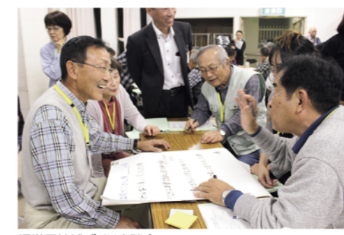
曙学区地域づくり座談会

曙学区 地域づくり座談会 曙学区は市中心部に位置し、子育て世帯も多く暮らす人口約7,600人の地域です。かつては農地が広がっていましたが、都市化が進み、急激に人口が増加しました。 役員の担い手不足や高齢化などの悩みを解決しようと、モデル事業の実施を希望。10代から80代まで約70人の住民が集まり座談会がスタートしました。 「地域に足りないこと」について率直に意見を出し合うと、「地元の人と新たにこの地で暮らした始めた人との交流が少ないことや「各団体間の情報共有・連携不足」などの課題が明らかになりました。