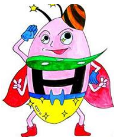
今津のスーパーヒーロー 「ホタマン」