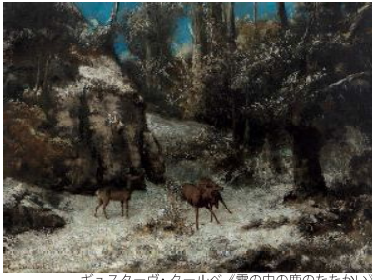
ギュスターヴ・クールベ《雪の中の鹿のたたかい》1868年 頃ひろしま美術館