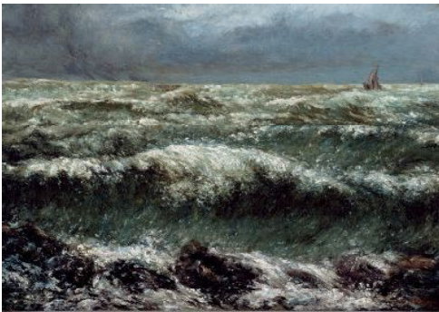
ギュスターヴ・クールベ《波》1869年 ぶくやま美術館

クールベはただ単純に波のみを、 岸辺に砕け散る本物の波を描いたのだ。 ———エミール・ゾラ