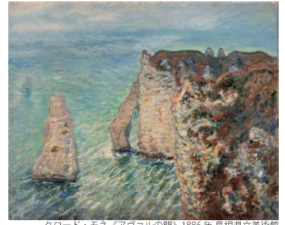
クロード・モネ《アヴァルの門》1866年 島根県立美術館