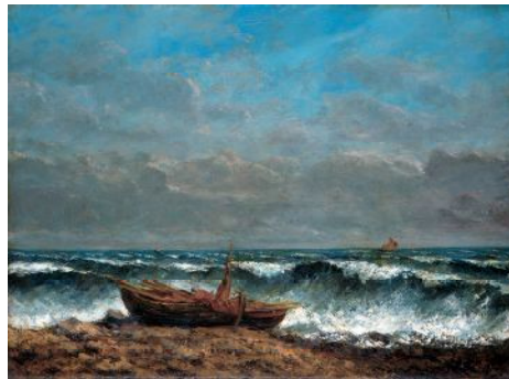
ギュスターヴ・クールベ《波》1870年 オルレアン美術館