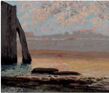
ギュスターヴ・クールベ《エトレット海岸、夕日》1869年 新潟県立近代美術館・万代島美術館

19世紀フランスで活躍した画家ギュスターヴ・クールベ(1819-1877)は、現実を理想化して表現するそれまでの絵画を否定し、目の前の世界を「あるがまま」に描いたリアリズム(写実主義)の画家として知られています。時の政治や伝統的な美術に激しく反発し、悲惨な労働者の姿を写實的に描いたり、浴女の姿を卑俗的に描くなど、「美しい」ものを表現すべきであった「美術」の概念を大きく変えました。