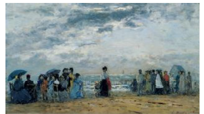
ウジェーヌ・ブーダン《浜辺にて》個人蔵

関連イベント *新型コロナウイルスの感染拡大等により変更があった場合は、ぶくやま美術館ホームページなどでお知らせします。