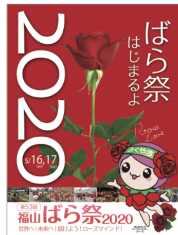
福山ばら祭2020ポスターデザイン 優秀賞 山田美由紀さん

申問 1/22(金)(必着)までに、福山祭委員会事務局補助(☎932-0191)へ