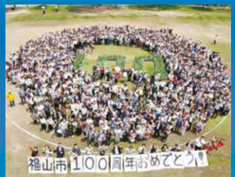
2016年(平成28年)5月21日100万本のばらのまち達成