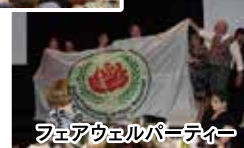
フェアウェルパーティー