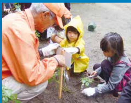
子どもの頃からばらにふれる環境づくり