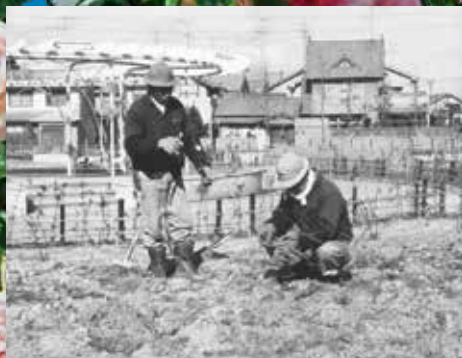
ばらを植える住民

そんなとき、現在のばら公園付近の住民の手によって、雑草だらけの空き地に約1,000本のばらが植えられた。植えられた一本一本のばらには、傷ついた心を慰め、生きる勇気と希望を取り戻したい、お互いに助け合ってこのまちをもう一度よみがえらせたいとの祈りが込められていた。