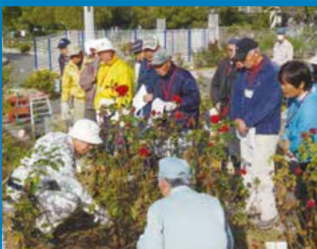
ばらづくりの担い手の育成

また、世界中の皆様を福山の心「ローズマインド」でお迎えし、市民とのふれあいを通して、平和の尊さを分かち合い、大会の意義を共有することで、大会に関わった全ての人に、それぞれの物語「ローズマインドストーリー」が生まれ、記憶に残る大会としていきます。