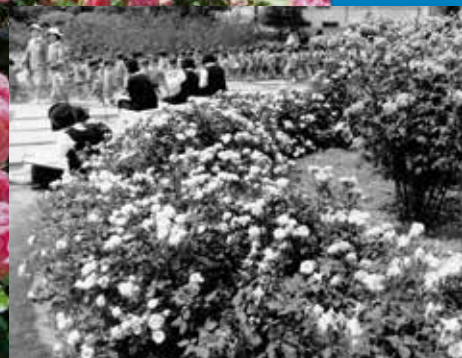
1968年(昭和43年)、第一回バラ祭の様子