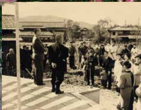
住民と福山市が協働でばらを植栽