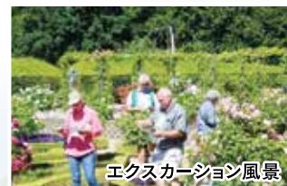
エクスカーション風景