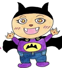
ふくやま子どもフェスティバル マスコットキャラクター-ふくみん