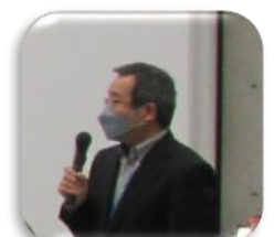
曙学区 清水委員長