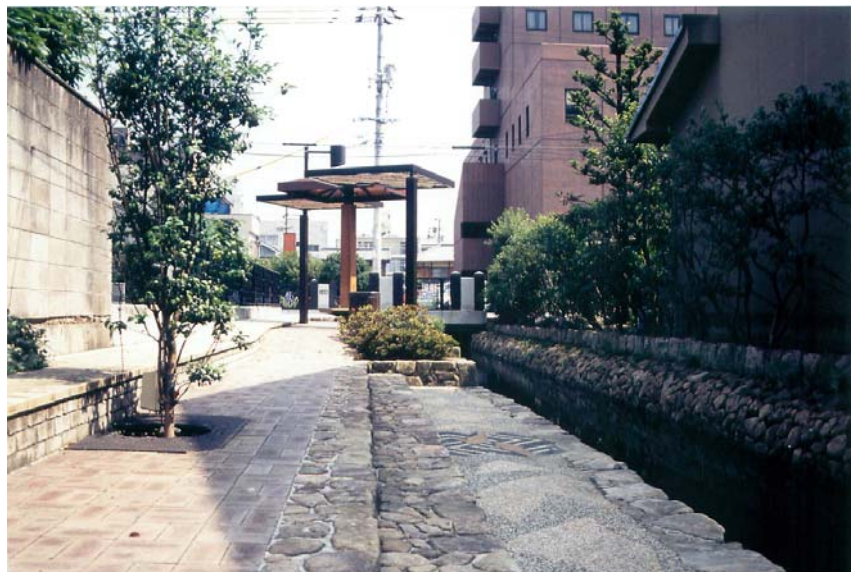
福山市道三川地区

市街地中心部において、川を活用した帯状の公園(遊歩道・親水広場等)として、従来の市街地を流れる川のイメージを払拭し、清流の川で人と水が触れ合い、快適で潤いがある環境に優しい水辺づくりを行っています。