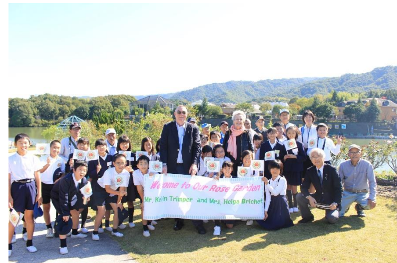
※前回視察時(2017年)の様子