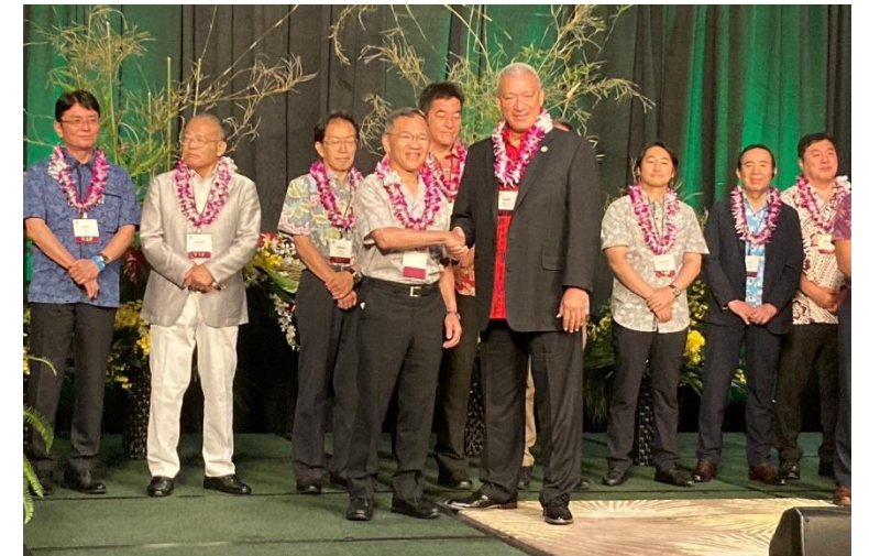
ハワイ州にてマウイ郡長と（2023年7月）