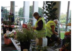
(大会ボランティア)