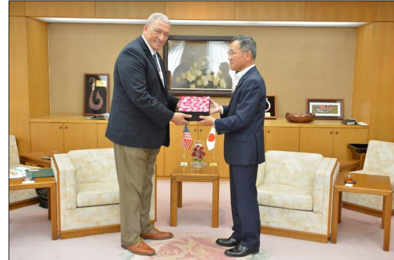
マウイ郡長による表敬訪問（2023年5月）