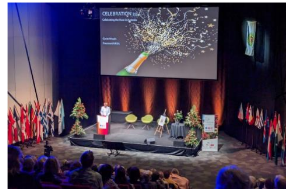
(世界バラ会議運営)