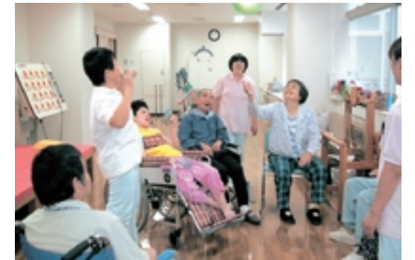
デイサービスセンター