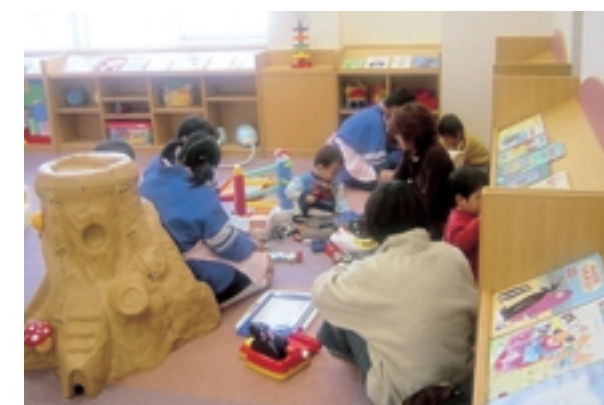
おもちゃ図書館(福山すこやかセンター)