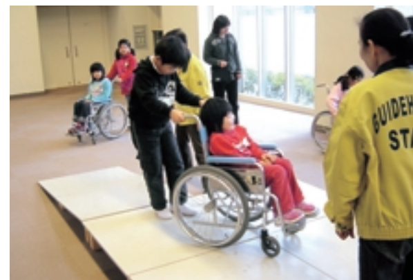
福山すこやかセンターでの活動風景