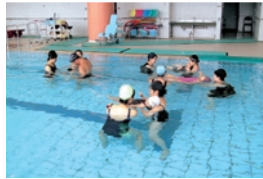
水中活動モデル講座