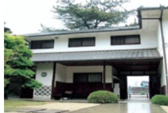
ぬまくま文化館(枝広邸)