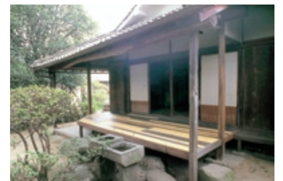
廉塾・菅茶山旧宅