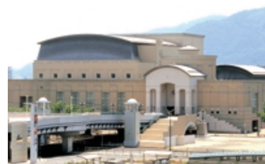
ふくやま芸術文化ホール(リーデンローズ)