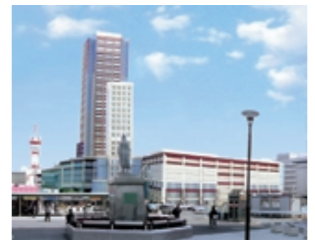
伏見町再開発(イメージ)