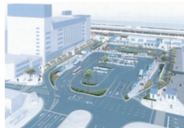
福山駅前広場整備(イメージ)