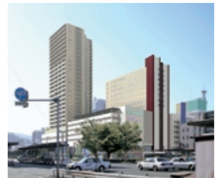
東桜町再開発(イメージ)