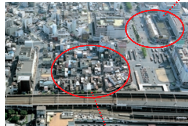
現在の福山市中心部