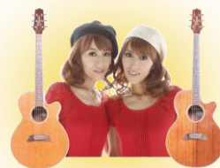
アジアツインズ 光と風Hi-Fu