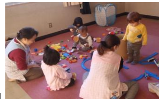
2014年度採択団体 【子育て支援ボランティアエンジェル・スマイル】 笑顔の子育て応援事業