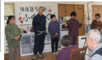
2014年度採択団体(備後語りの会「ふくふく」) 民話の伝承、語り手の育成事業