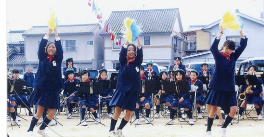
川口小学校吹奏楽クラブ