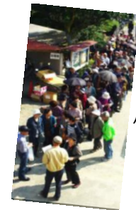
バラ苗配布に 長蛇の列