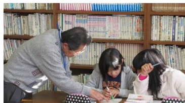
土曜チャレンジ教室の様子