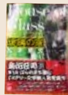
第1回受賞作 『玻璃の家』 (講談社)