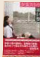
映画化される優秀作 『少女たちの羅針盤』 (原書房)