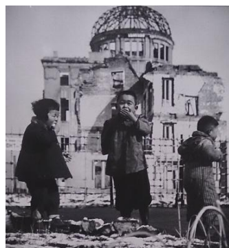
広島 雪を食べる子ども たち