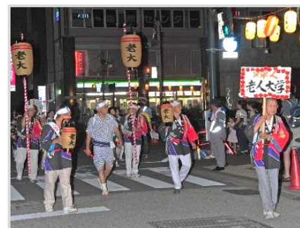
宮通りをパレード