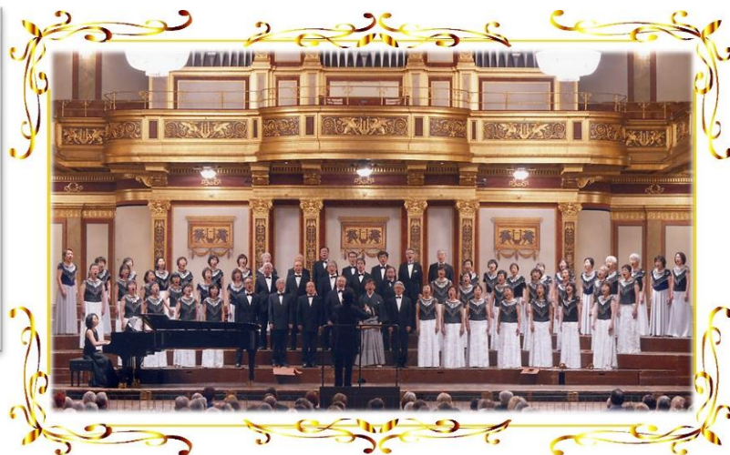
2013.1 ウィーン楽友協会大ホール新春コンサートに出演