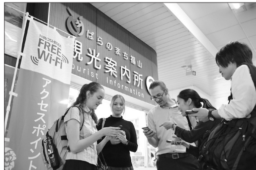
無料公衆無線LAN (JR福山駅観光案内所)