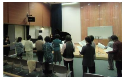
10月13日、会場：沼隈支所

先月から、一曲通しての練習が行われるようになりました。CDに合わせて歌っていると、スピードに合わすことに必死で、一音一音を丁寧に歌えていない気がします。途中で先生から、もう少し柔らかくや、強弱の指導をしていただくのですが、その音を出すのに精いっぱい、なかなか質まで意識して歌うことができませんでした。全体の練習の前にパートごとや個人で、発声を見ていただいているので、一人ひとりのレベルアップにもつながります。