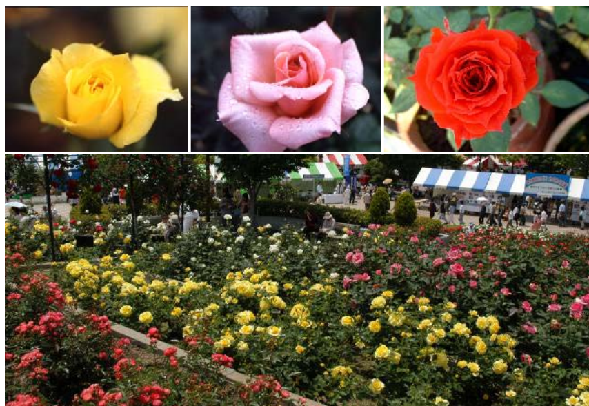
■ 福山のシンボル・ばらとばら公園 ■