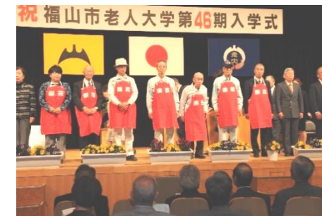
ユニークな講師紹介