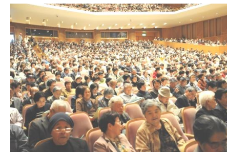
詰めかけた学生たち