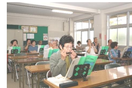
新設のハーモニカクラブ

音楽・ダンス、ゲートボール、卓球、ペタンク、囲碁・将棋 写真とパソコン、ボランティア、 軽音楽、ハーモニカ、イングリッシュカラオケ