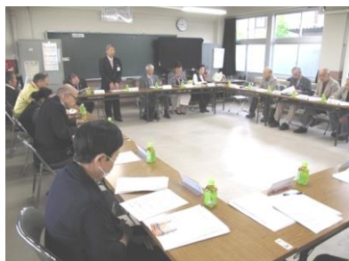
1-2教室で 事務懇談会