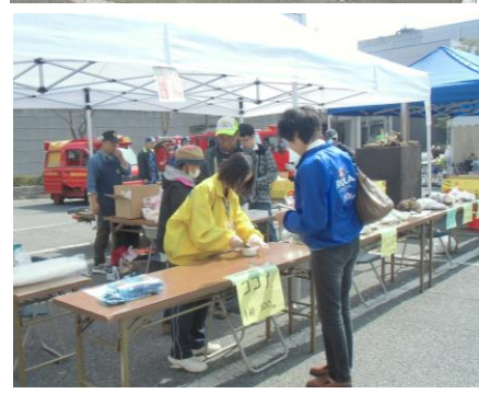
※昨年度の様子です。