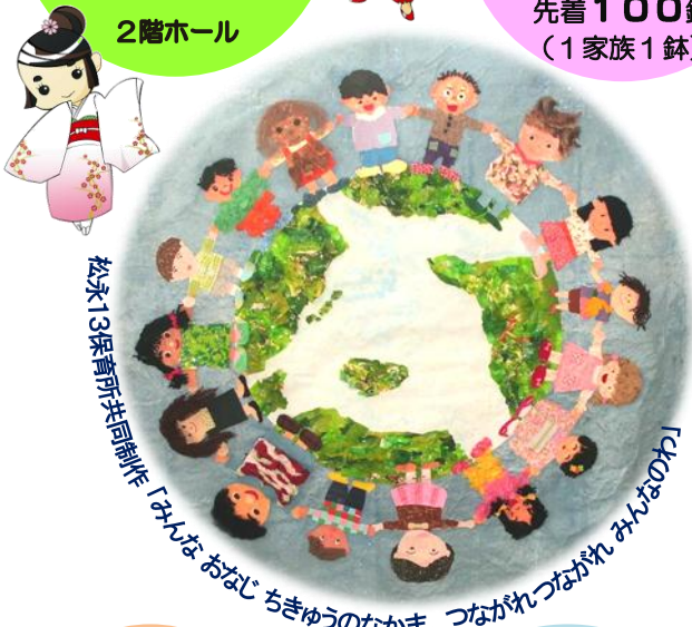
松永13保育所共同制作「みんなおなじちきゅうのなかま、つながれつながれみんなのわかれ」

「カープ チェー(Carpe Diem)」とは ラテン語で「今日一日を有意義に使いましょう、楽しみましょう」という意味です。まつながカープチェーに参加されたすべてのみなさんにとって有意義な楽しい日になり、この日を出発に新たな交流・友情が始まることを願っています。