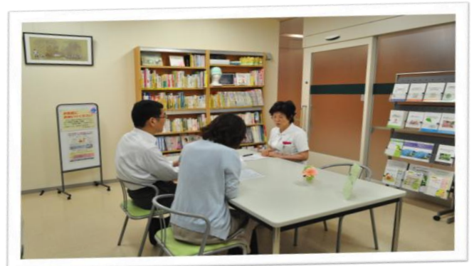
【がん相談支援センター風景】